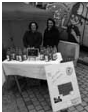
Opération « jus de pomme »

L'ensemble du conseil d'administration des parents d'élèves de l'école immaculée vous souhaite une bonne et heureuse année 2012. Nous serons présents pour vous rencontrer et partager le 3 février lors des portes ouvertes de l'école maternelle.