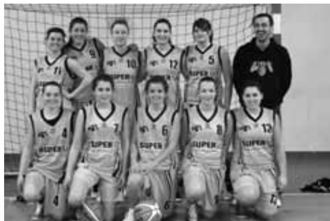
De nouveaux maillots pour l'équipe fanion féminine

Belle réussite cette année du tournoi où 8 équipes gars et 3 équipes filles ont participé le 16 décembre au tournoi nocturne. Toutes les équipes ont pu se retrouver sur les 2 terrains de Beauséjour. Le tournoi s'est déroulé dans la bonne humeur. Melesse s'impose en finale.