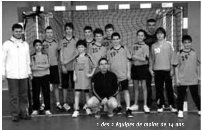
1 des 2 équipes de moins de 14 ans

Le handball français termine 2011 en étant le sport collectif le plus titré du sport français. L'équipe de France féminine est vice-championne du monde tandis que les masculins ont réussi un incroyable triplé : champion olympique, du monde et d'Europe. Plus modestement, à Mordelles, ce sont près d'une centaine de personnes (licenciés, familles et proches de la section) qui ont partagé leur dernier samedi de handball 2011 entre une belle victoire disputée de l'équipe fanion masculine et une non moins excellente tartiflette dans une ambiance très conviviale. L'ensemble du bureau se joint au président pour présenter au nom de l'USM Handball