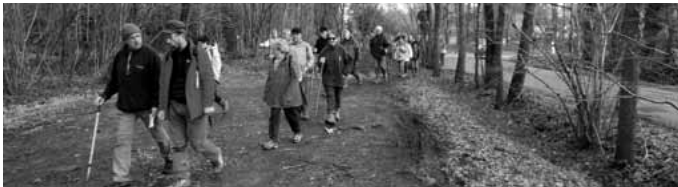
L'année 2012 a très bien débuté pour les 57 randonneurs au Bois de Soevres à Vern sur Seiche.