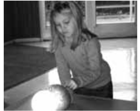
Animation « astronomie »

Le 1er décembre... le voyage a continué à l'école pour les enfants de GS et de MS autour d'une animation assurée par un intervenant du Planétarium. Des jeux de rôles ont permis aux enfants de s'initier à l'astronomie de manière ludique et interactive. Ce même voyage en deux temps (visite au Planétarium et animation à l'école) sera proposé aux enfants de PS/ MS en janvier 2012.