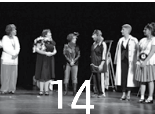
Abyme n'abime pas Mille Bravos... bien au contraire !