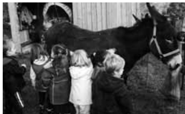
Découverte des animaux de la ferme

Bon Noël et joyeuses fêtes de fin d'année à tous les Mordellais.