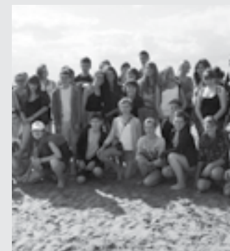
Collège public Morvan Lebesque