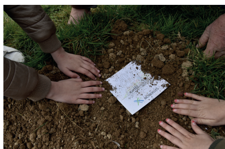
Plantation en terre dans le jardin partagé du « 38 »

Savez-vous planter les cartes, à la mode de chez nous ? Opération « Plantation de cartes de vœux 2021 » avec les jeunes Mordelais !