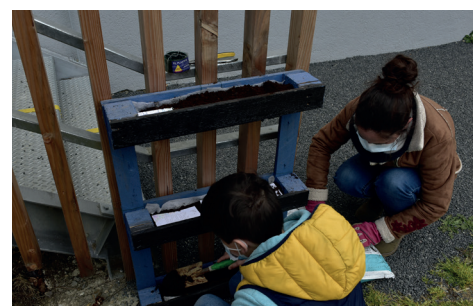
Plantation en jardinière devant le « 38 »

Pour sa communication institutionnelle, la Mairie a fait le choix en janvier dernier de présenter ses vœux avec une carte ensemencée de graines de fleurs mellifères, en cohérence avec le projet de mandat autour de la transition. Ces fleurs attirent particulièrement les insectes pollinisateurs indispensables pour favoriser la biodiversité, assurer la croissance des plantes et la production de fruits et légumes. La Mairie ayant des cartes en surplus, les a distribuées au service Éducation, enfance, jeunesse, pour une opération « Plantation de cartes de vœux ». Les enfants de l'accueil Passerelle, ainsi que certains élèves, lors du temps périscolaire, ont mis les mains à la terre pour préparer le sol, planter les cartes, recouvrir de terre fine, arroser... Maintenant il faut faire preuve de patience, attendre que cela pousse et espérer que les vœux se réalisent !