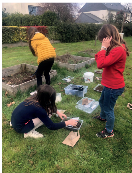
Plantation en terre à l'école de la Chesnaye

Les enfants de l'Accueil Passerelle et ceux du périscolaire ont semé leurs cartes de vœux la semaine dernière. Attendons que ça pousse !