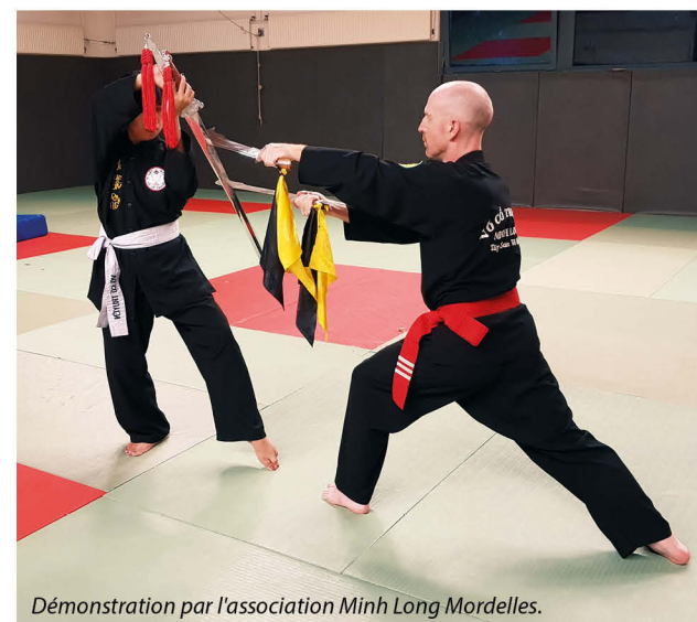
Démonstration par l'association Minh Long Mordelles.

Des démonstrations de Minh Long, de danse orientale, tzigane, de tennis de table agrémenteront votre après-midi.