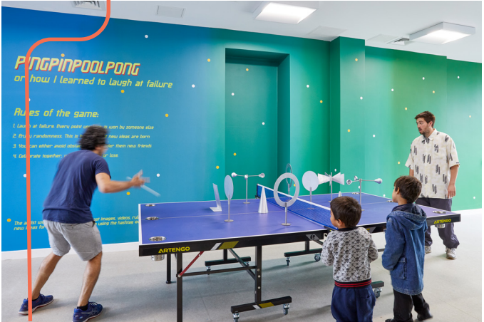
Basim Magdy, 2018.